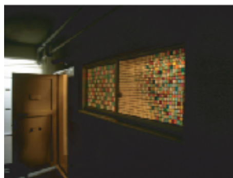
403 廊下窓ステンドグラス